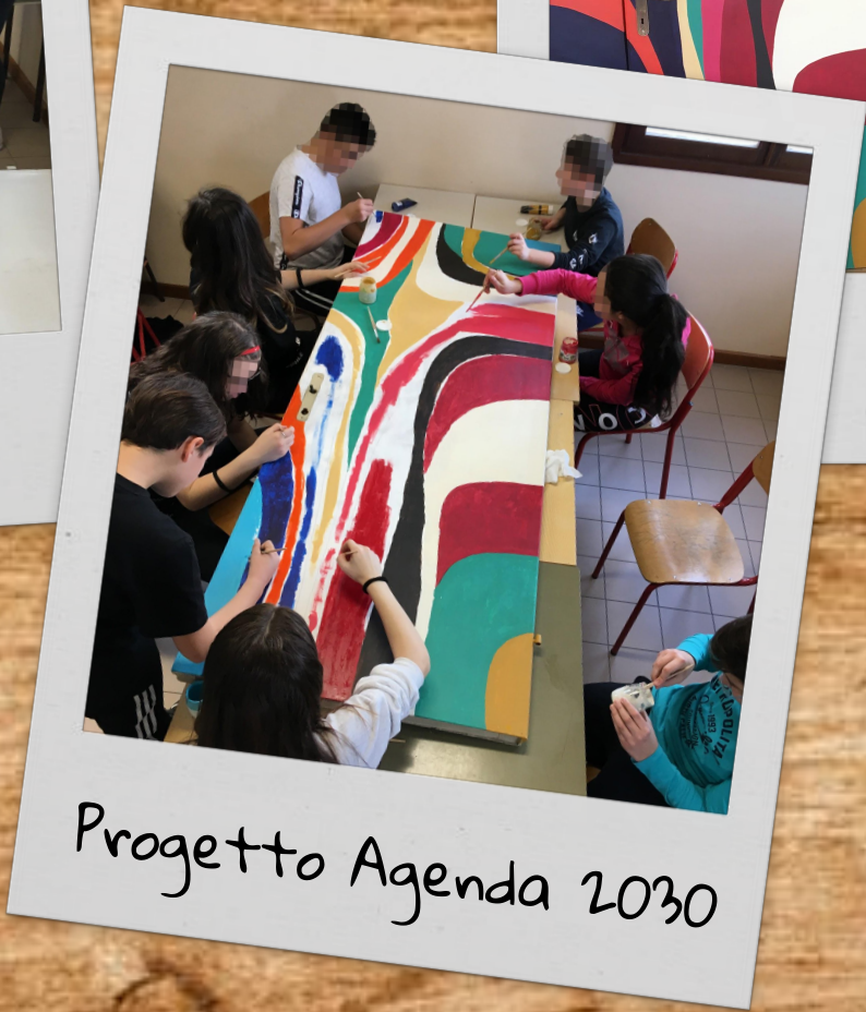
Progetto Agenda 2030