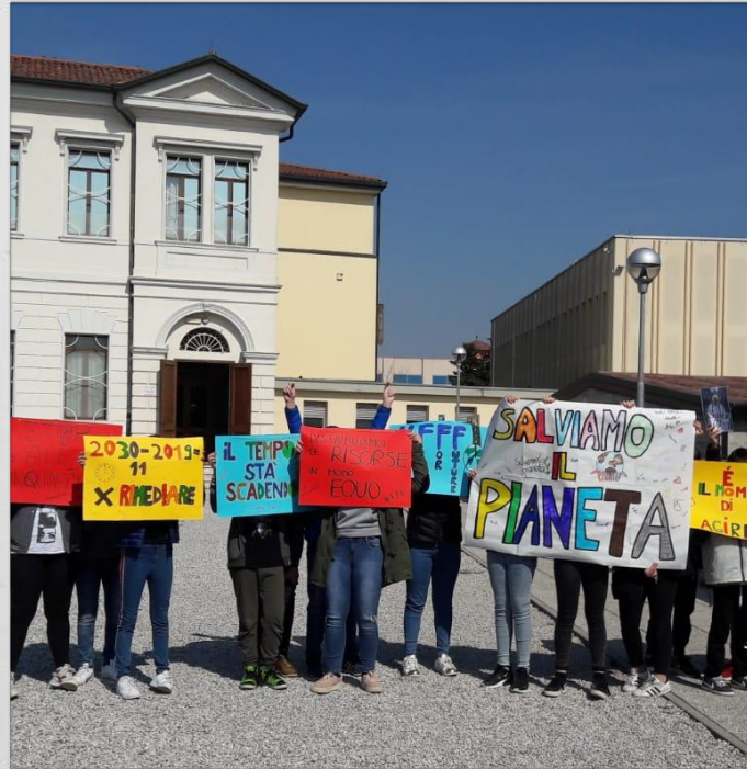
Fridays for future