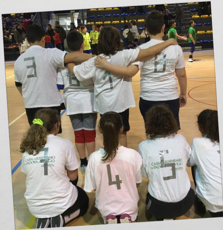
Torneo di Pallavolo